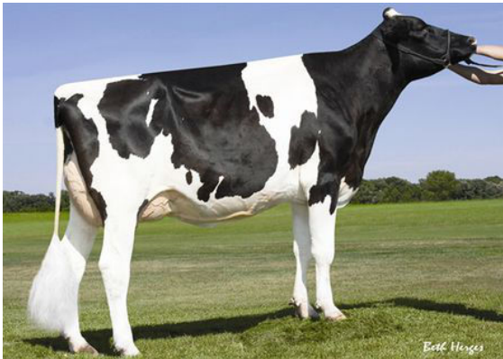
COURTLANE-UR CHASSITY Dam